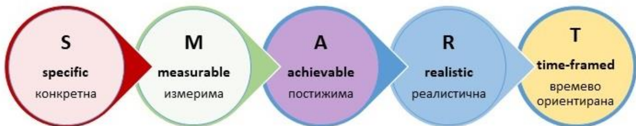
Фиг. 3 – Схема описваща модела SMART

Препоръчваният подход за определяне на задачите е използването на модела SMART. Това е акроним за специфична (конкретна), измерима, постижима, реалистична и времево-ориентирана задача.